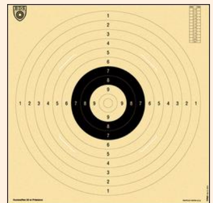
Scheibe für Präzision

Wertung: Die 20 Schuss Präzision können getrennt von den 40 Schuss Kombi gewertet werden, so dass auch nur Präzision geschossen werden kann.